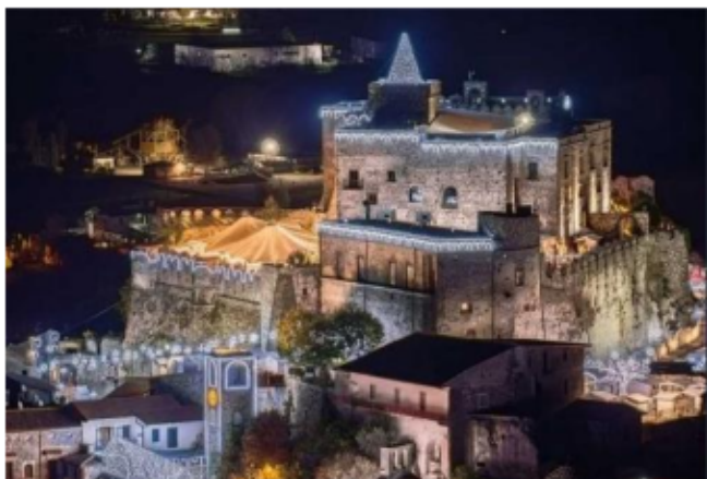
リマトーラ城

毎年8月中頃に、中世の街は当時の素晴らしい歴史を再現する舞台となります。このイベントは、イタリアでも最も豪華で優雅なイベントのひとつであり、「コスタンツァ王女の食卓」が再現されます。実に3日間に渡り開催されるお祭りでは、まるでタイムスリップしたかのような時間を味わうことができます。