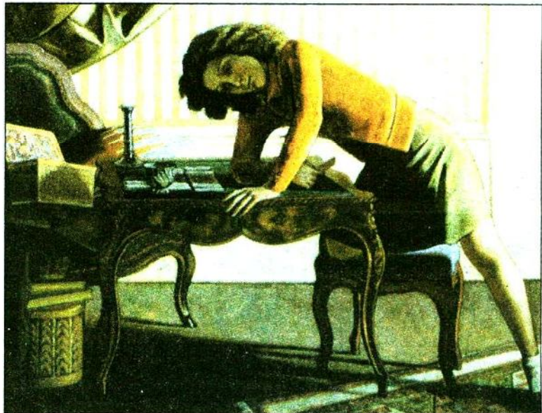
'Paciencia', otra obra característica.

obra como en El cuarto turco (1963-66), Japonesa ante la mesa roja (1967-76) y Desnudo de perfil (1973-77).