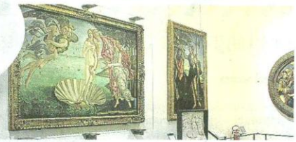
Arte concentrado. Vale la pena visitar la galería de los Uffizi, que exhibe una de las mayores colecciones de obras renacentistas del mundo.