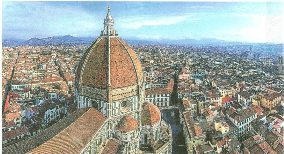
El gigante. La catedral se impone sobre la ciudad de techos anaranjados.

La tarde se asoma con una visita obligada: la catedral de