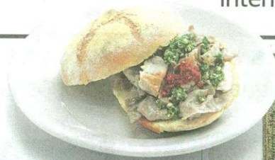
Lampredotto. Típico sándwich relleno con carne de estómago de vaca.