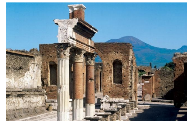
ポンペイ

オンライン購入、ナポリ中央駅のカンパニア・アルテ・カードセンター、主要な提携美術館・博物館