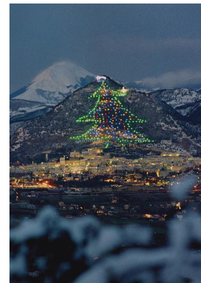
グッビオのクリスマスツリー