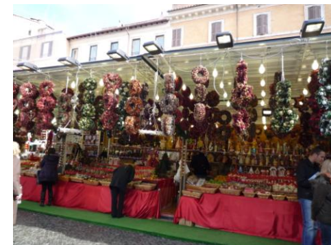
ナヴォーナ広場のクリスマスマーケット