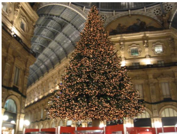
ミラノのガッレリア